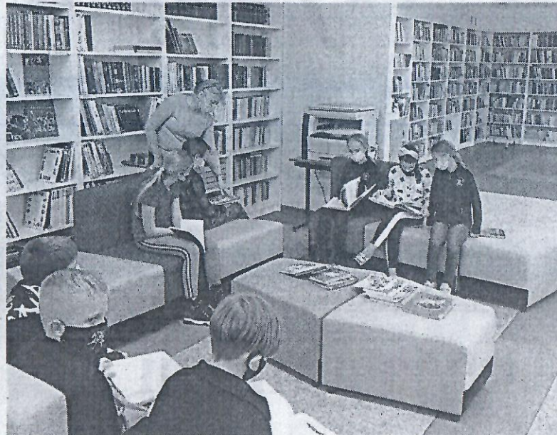
► Skaitymo ir rašymo užsiėmimas atnaujintoje bibliotekoje

Penktų-aštuntų klasių mokiniai šiuo sudėtingu laikotarpiu mokosi ir vykdo veiklas nuotoliniu būdu. Įvyko respublikinis mokinių kūrybinių darbų konkursas „Daukanto stiprybė – dabarčiai“, kūrybinės dirbtuvės „Kurk kartu“, VIa klasės mokiniai susipažino su tapytoja, sce-